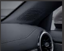
Geavanceerd geluids-systeem (853)