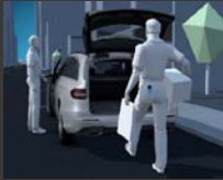
KEYLESS-GO package (P17)