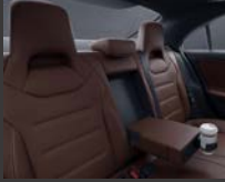
Armsteun achter (400)