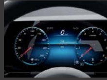
Widescreen cockpit (458)