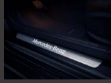
Verlichte instaplijsten (U25)