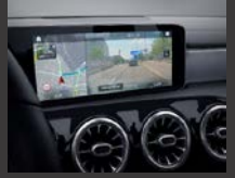
Augmented reality voor navigatie (U19)